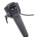
Commande double Invacare IDC