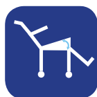
Angle d'inclinaison d'assise ▼