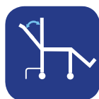
Angle d'inclinaison de dossier ▼