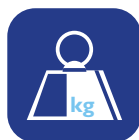
Poids total ▼