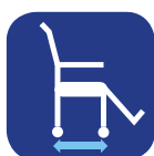
Profondeur d'assise ▼