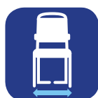
Largeur hors-tout ▼