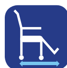
Profondeur hors-tout ▼