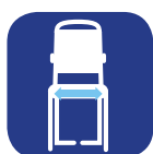
Largeur d'assise ▼

Pour plus de renseignements, rendez vous sur notre site internet www.invacare.be/fr . Retrouvez-y le manuel d'utilisation ainsi que toutes les informations liées à ce produit.