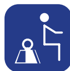
Poids max. utilisateur ▼