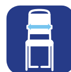
Largeur entre les accoudoirs ▼