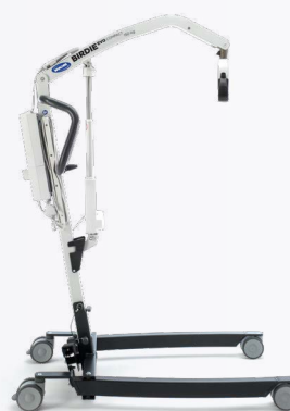
Birdie EVO COMPACT

Une version évoluée du Birdie, leader sur le marché des lève-personnes passifs, conçu pour réaliser des transferts sûrs à la fois au domicile et également en collectivité.