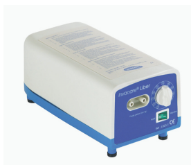
Invacare Liber compressor (L803)