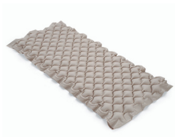
Invacare Eskal wisseldrukmatras (L839)