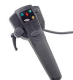
Invacare IDC dubbele bediening