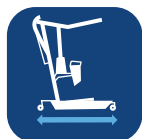
Lengte basis ▼