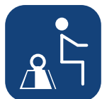
Max. gebruikersgewicht ▼

Alle afmetingen zijn genomen met 100 mm wielen, tussenvoetplaat en een persoon van 80 kg. Voor 75 mm wielen (COMPACT), stel de hoogtematen in op 15 mm minder. Alle metingen zijn uitgevoerd met een tolerantie van +3%.