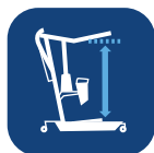
Hefbreik (met verkorte/verlengde hefarm) ▼