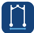
Breedte basis ▼