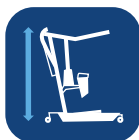
Max. hoogte (met verkorte/verlengde hefarm) ▼