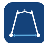
Binnenbreedte (benen open) ▼