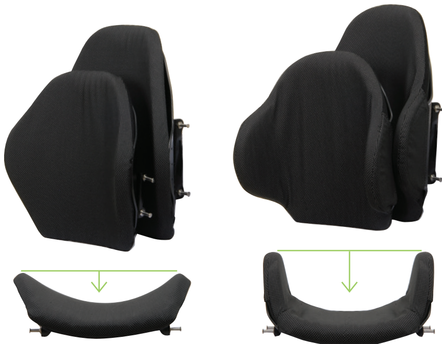
▲ E2 Rug Elite E2 - 80 mm Contour