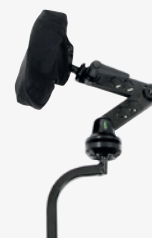
Invacare Matrix® Elan hoofdsteun