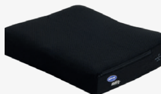
Invacare Matrix® Libra kussen