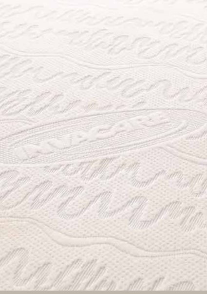
Opties / Options