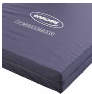
Blauwe hoes / Housse bleue