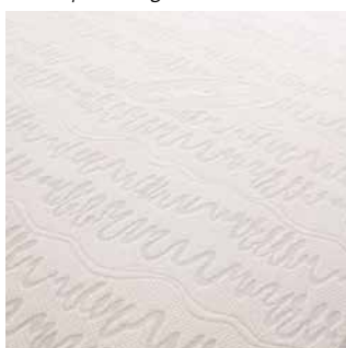
Witte hoes / Housse blanche

Doubleure imperméable disponible en option.